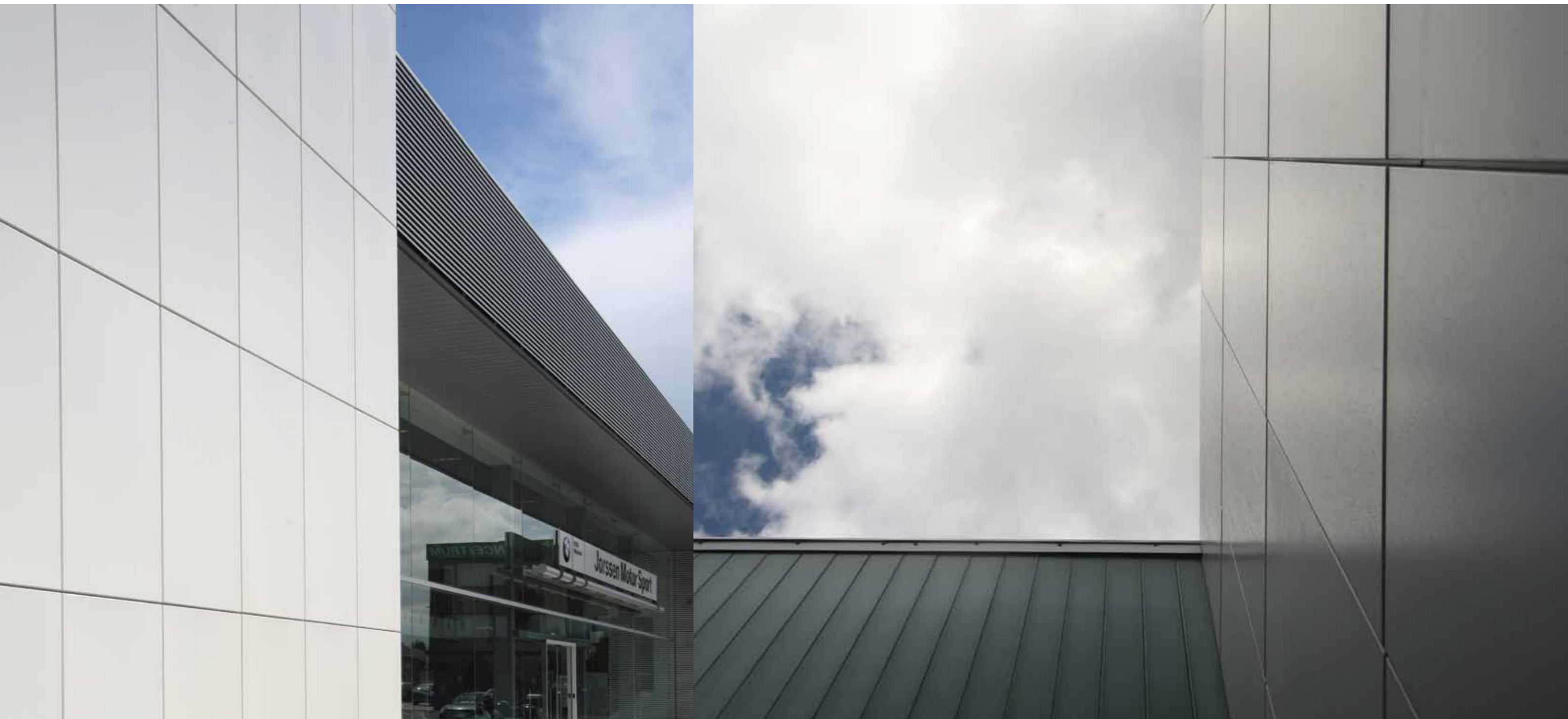
Jorssen Wilrijk (B) | Architect: Architeam (B) | Limeparts: aluminium powder coated

Strak, naadloos en een superieure kwaliteit. Dat vormt in een notendop de succesformule van de gelakte aluminium cassettes , de 'traditional' onder de cassettegevels van Limeparts. Het afdrukken van de hoeken en het gebruik van inox bevestigingsmaterialen garanderen een superieure kwaliteit. Dankzij de uitgebreide kleurkeuze en de grote vormvrijheid kunnen deze aluminium cassettes perfect elk creatief ontwerp vorm geven. Behalve de rechte cassettes behoren ook de ronde en gefacetteerde cassettes tot de mogelijkheden.