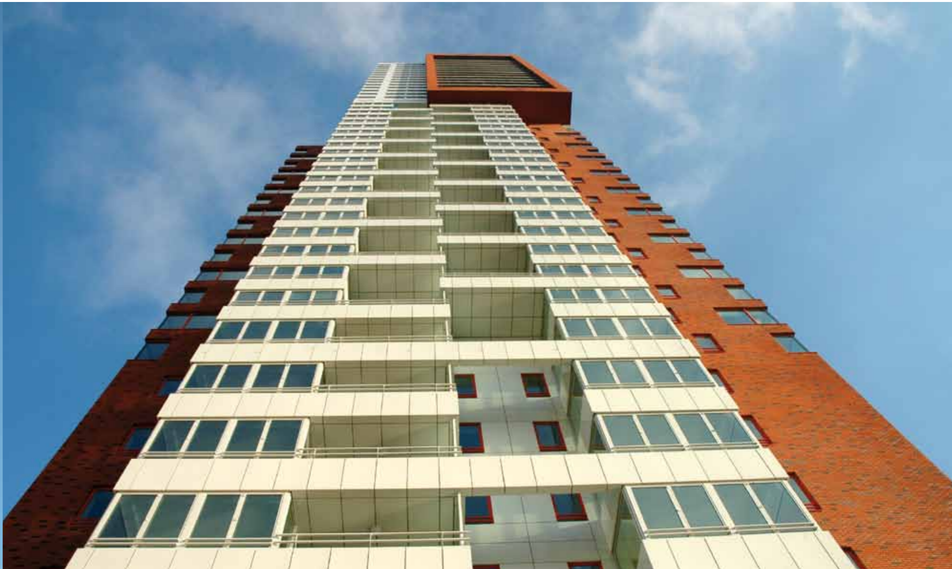
Montevideo, Rotterdam (NL) | Architect: Mecanoo (NL) | Limeparts: aluminium powder coated