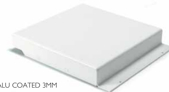
ALU COATED 3MM