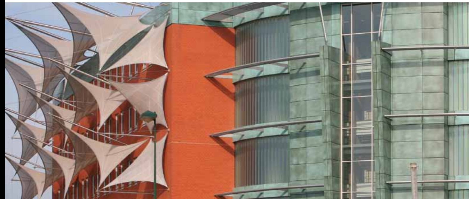
Eole Gosselies (B) | Architect: Igretec (B) | Limeparts: aluminium coppergreen