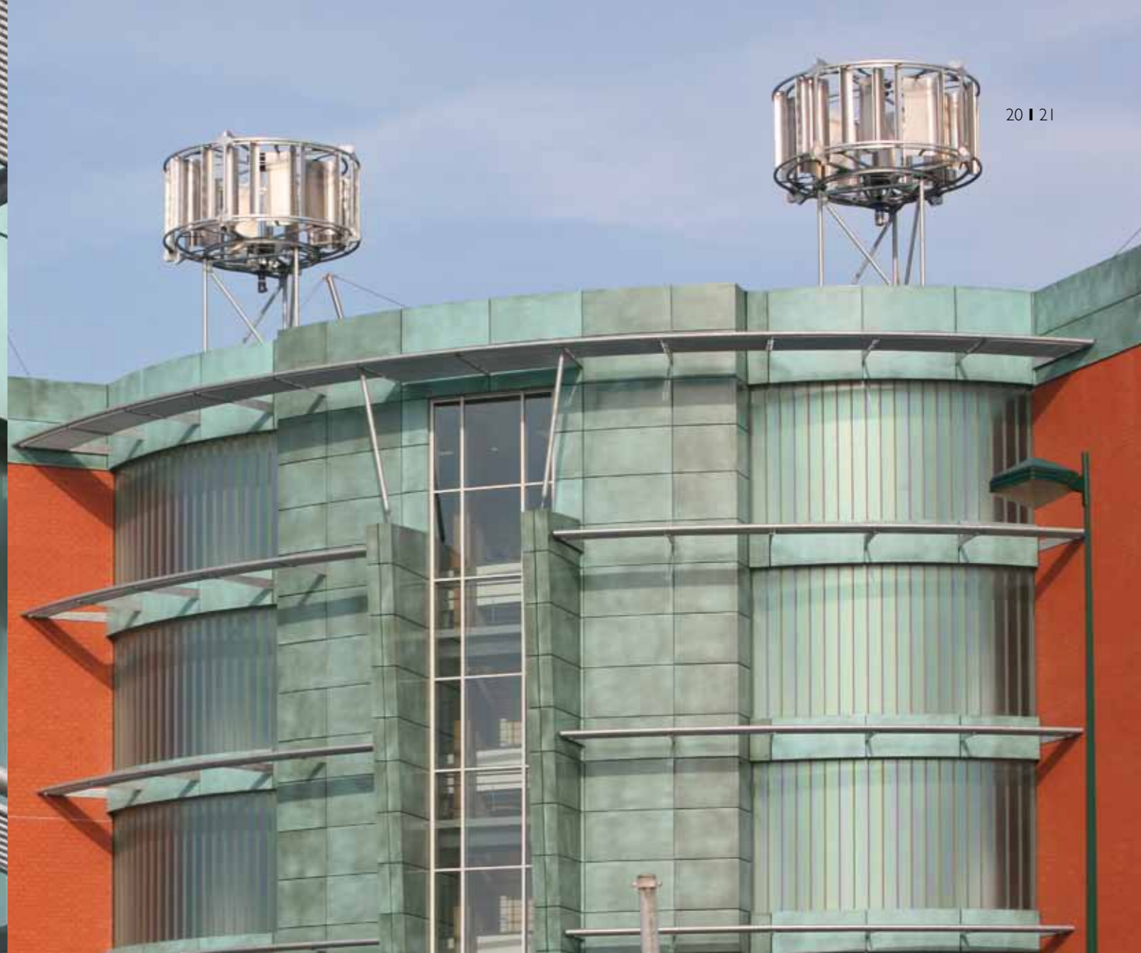
Eole Gosselies (B) | Architect: Igretec (B) | Limeparts: aluminium coppergreen