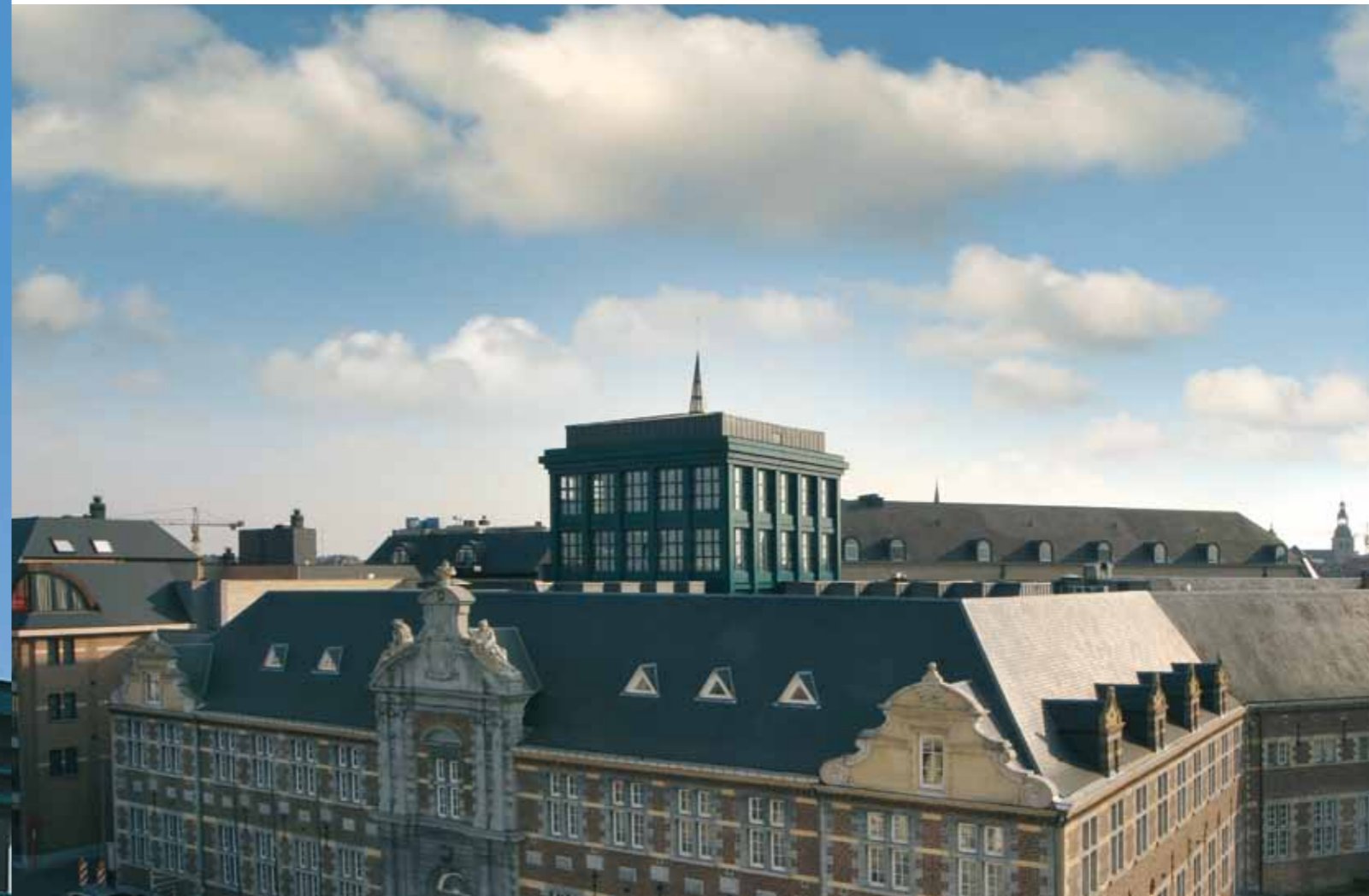
Oud Gasthuis, Hasselt (B) | Architect: De Gregorio & Partners (B) | Limeparts: aluminium powder coated