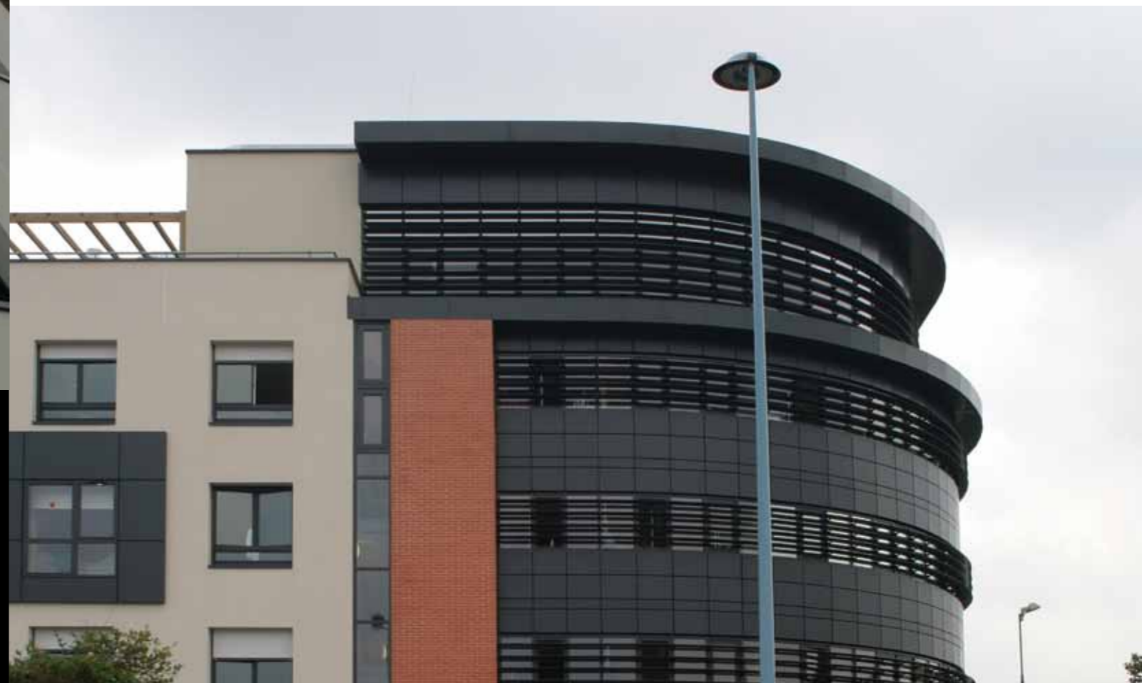
Centre de Rééducation Fonctionnelle Cos Bobigny (F) | Architect: Brandon et Daugey Dijon (F) | Limeparts: aluminium powder coated