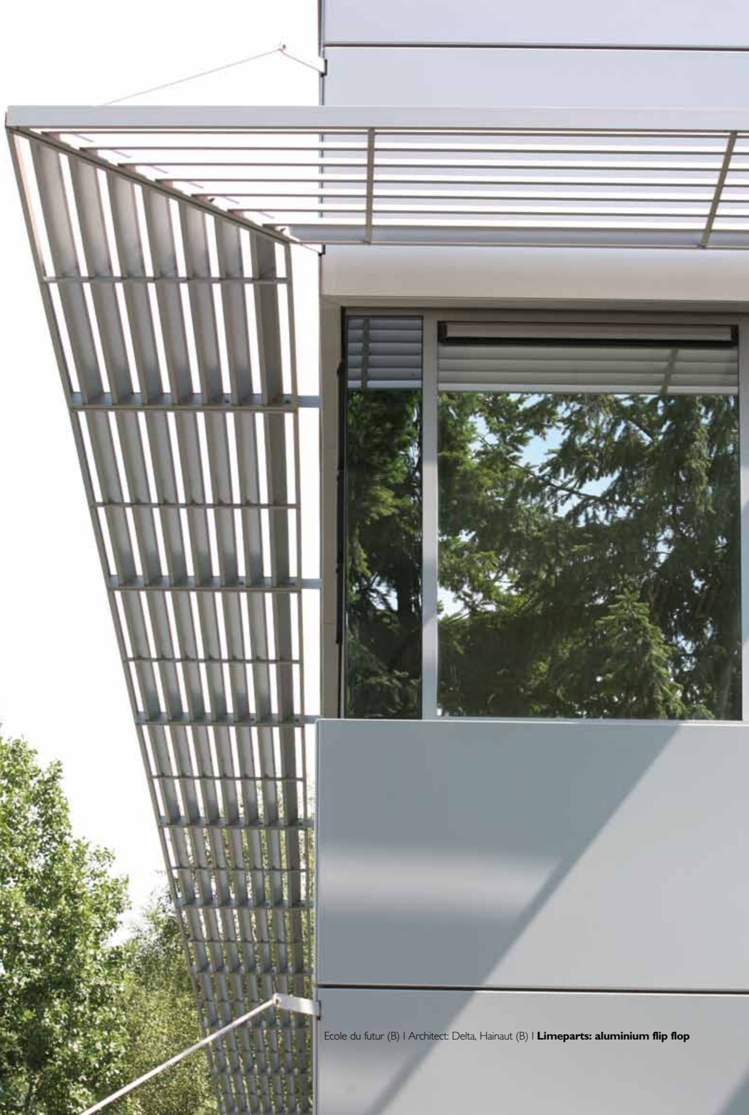
Ecole du futur (B) | Architect: Delta, Hainaut (B) | Limeparts: aluminium flip flop