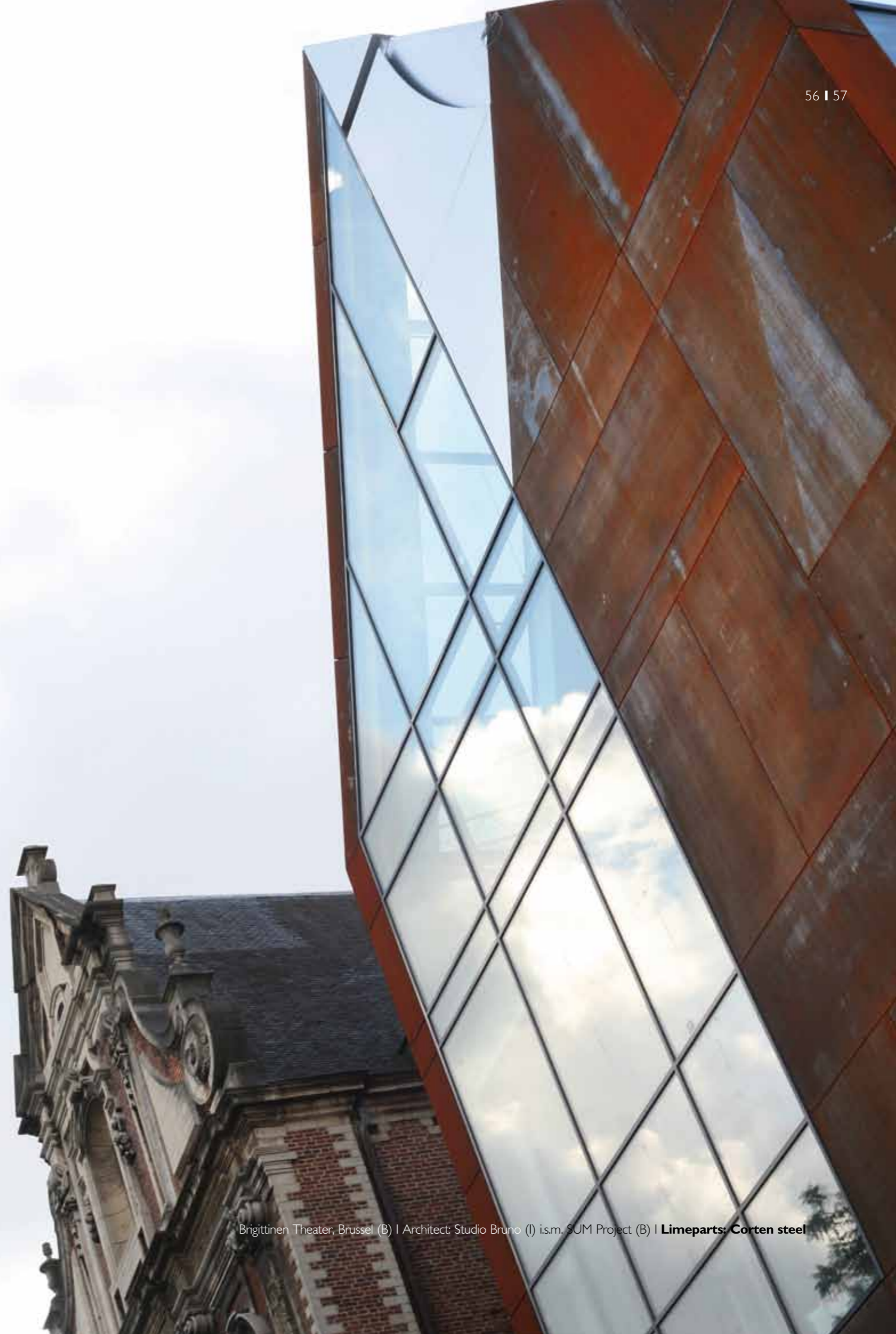
Brigitte Theater, Brussel (B) | Architect: Studio Bruno (I) i.s.m. SUM Project (B) | Limeparts: Corten steel