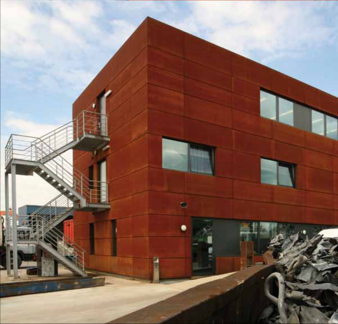
Stelmet (B) | Architect: E.S.A. Studiebureau (B) | Limeparts: Corten steel